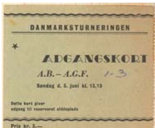
Billet AB-AGF 5 juni 1955