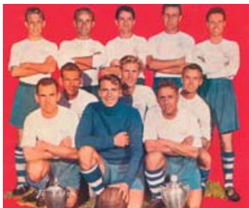
DM vindere 1955

I AGF's omklædningsrum var jublen ubeskrivelig. Pressefolk kæmpede med entusiastiske aarhusianere om at få adgang til det trophede omklædningsrum, og da pressefolkene gik af med sejren, fik glade jyder åbnet et vindue udefra og stak hovederne ind og ønskede til lykke.