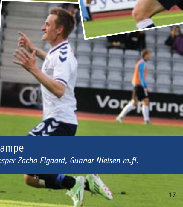
Forårets kampe