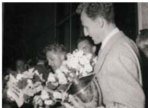
Hyldest på rådhuset

Ligger du inde med gamle effekter med relation til AGF, som du kunne tænke dig at skænke til AGF's historiske samling, vil AGF gerne høre fra dig. Det kunne være en scrapbog, fotografier, gamle programmer og billetter, plakater, medaljer, nåle/emblemer, erindringsgaver, trøjer, blade og magasiner eller korrespondance. Eller har du en beretning af egne AGF-oplevelser, som du vil dele med klubben, hører vi gerne fra dig. Med din donation vil du være med til at bevare klubbens historie. Kontakt AGF's Ole Hall på mobiltelefon 51 57 32 34 eller på e-mail: oh@agf-as.dk